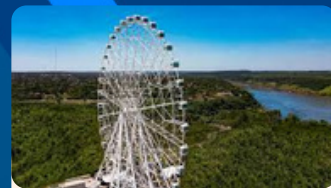
RODA GIGANTE R$ 30 á 59 TRF 221 á 250

Gostou dos nossos atrativos? Para mais informações entre em contato: