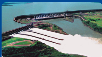
ITAIPU R$ 30 á 60 TRF R$ 255 á 290