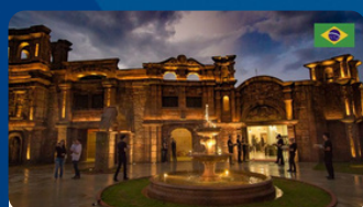
MARCO DAS TRÊS FRONTEIRAS R$ 23 á 46 TRF R$ 221 á 250