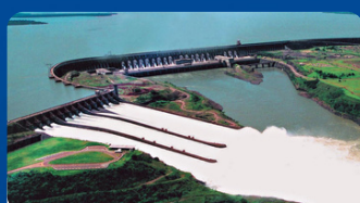
ITAIPU ESPECIAL R$ 86 á 172 TRF R$ 255 á 290