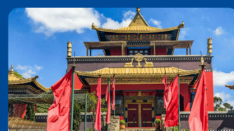
TEMPLO BUDISTA GRATUITO