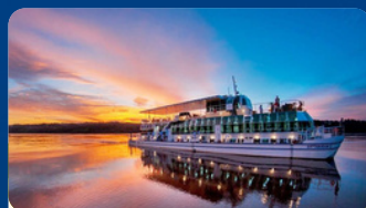
POR DO SOL COM JANTAR R$ 120 á 229 TRF R$ 300