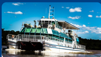
ENCONTRO DAS ÁGUAS ALMOÇO R$ 120 á 229 TRF R$ 300