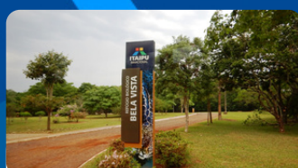
REFÚGIO BIOLÓGICO R$ 23 á 45 TRF R$ 255 á 290