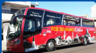
CITY TOUR PY R$ 295