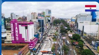
COMPRAS PARAGUAI TRF R$ 350 á 400